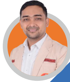
MIMIASRI, S.E, M.M